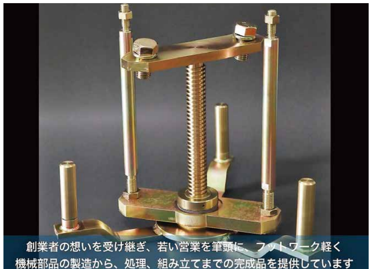
創業者の想いを受け継ぎ、若い営業を筆頭に、フラットワーク軽く機械部品の製造から、処理、組み立てまでの完成品を提供しています