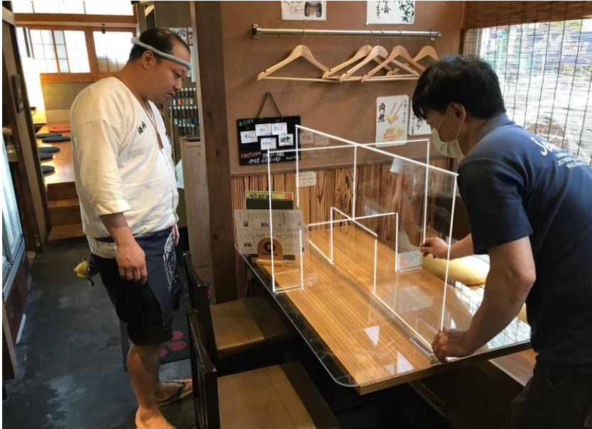
【飲食店のテーブルに飛沫防止パネルを設置した例】

専門家の助言・提案を活かして、ぜひ店舗の改善をご検討ください。 専門家の提案書に沿う改善には、下記の助成金が交付されます。