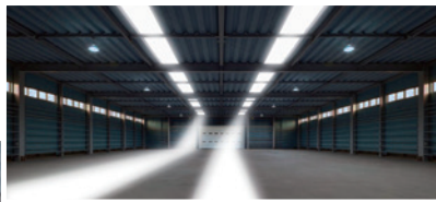
◀従来品の光の射し込み