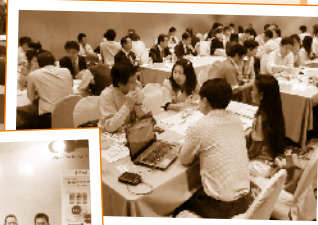
海外企業との商談会