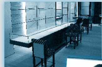
西尾硝子鏡工業所が手掛けるブランドショーケース

若手経営者や営業担当者にぜひ受講してもらいたいと考えています。受講生同士のネットワークや、成功事例の共有ができることが財産になります。価格以上の価値がある講座です。