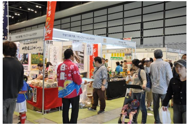
〈商い・観光展実施風景〉